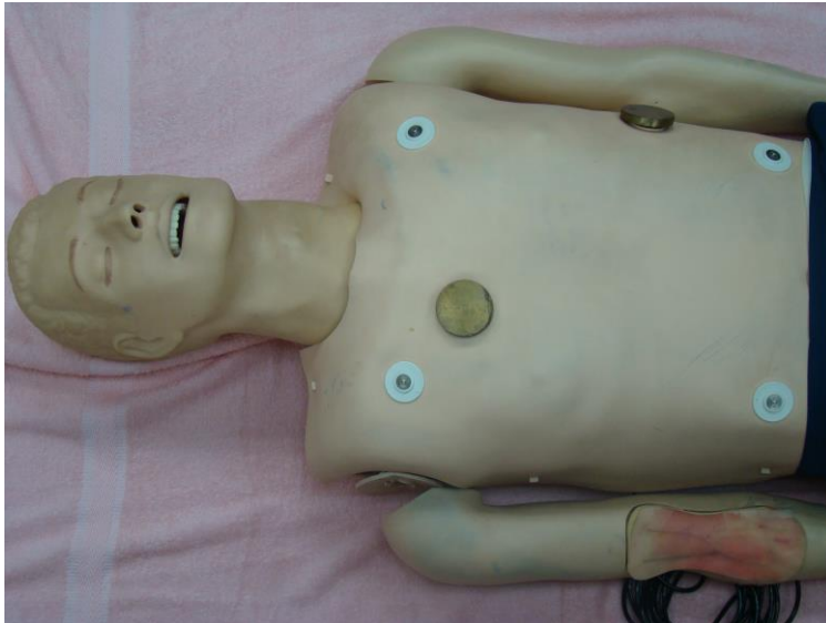
กล่องหมายเลข 4