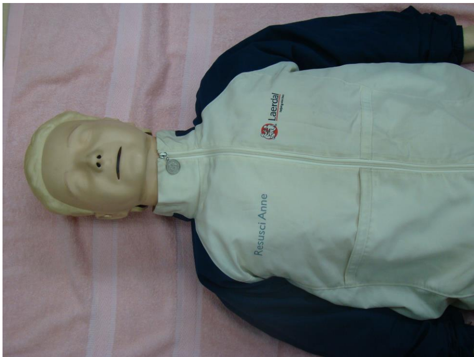
กล่องหมายเลข 2